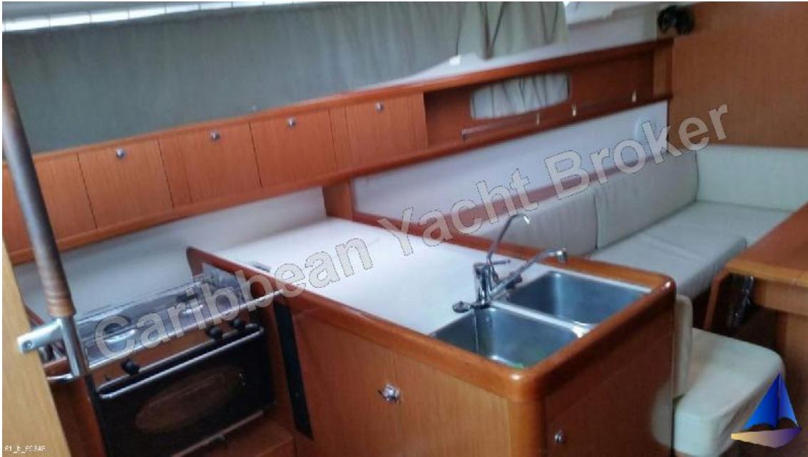
Cabin / Beneteau Oceanis 37 - 2010