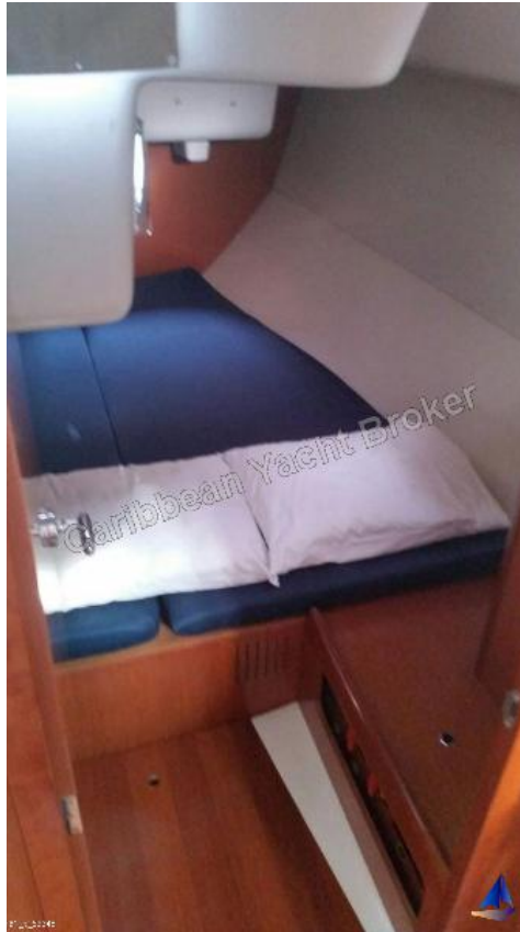
Layout / Beneteau Oceanis 37 - 2010