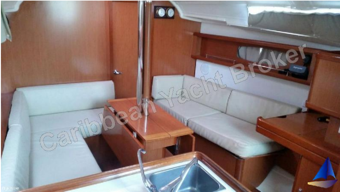
Navigation / Beneteau Oceanis 37 - 2010