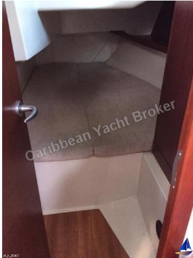
Bath / Toilet / Hanse 350 - 2009