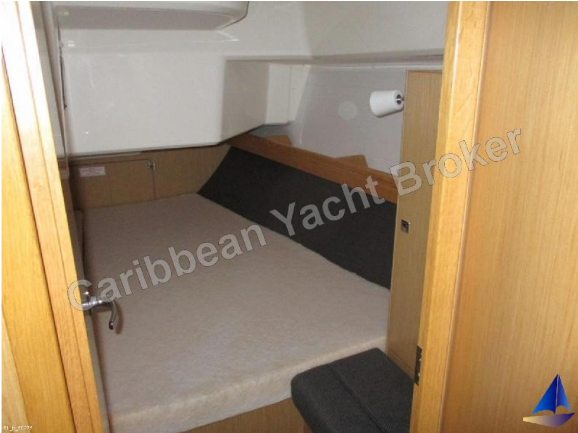
Bath / Toilet / Bavaria Cruiser 37 - 2016