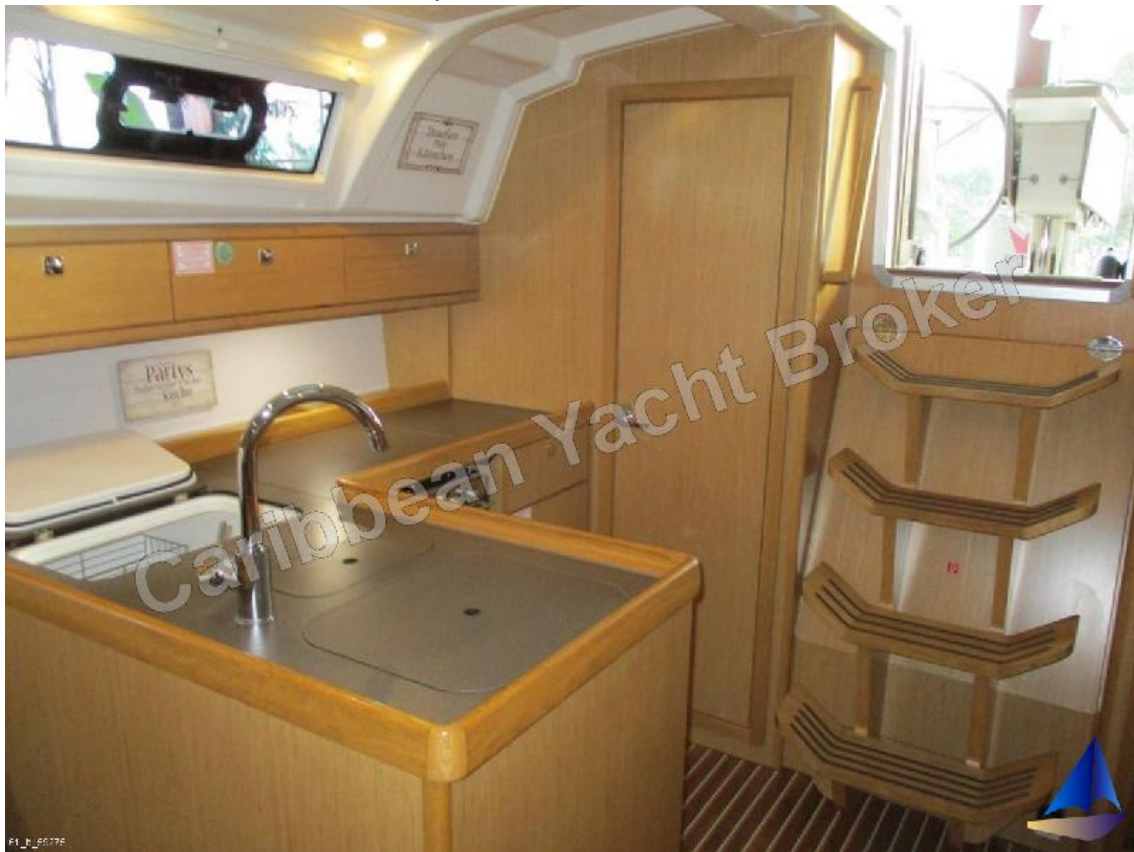
Cabin / Bavaria Cruiser 37 - 2016